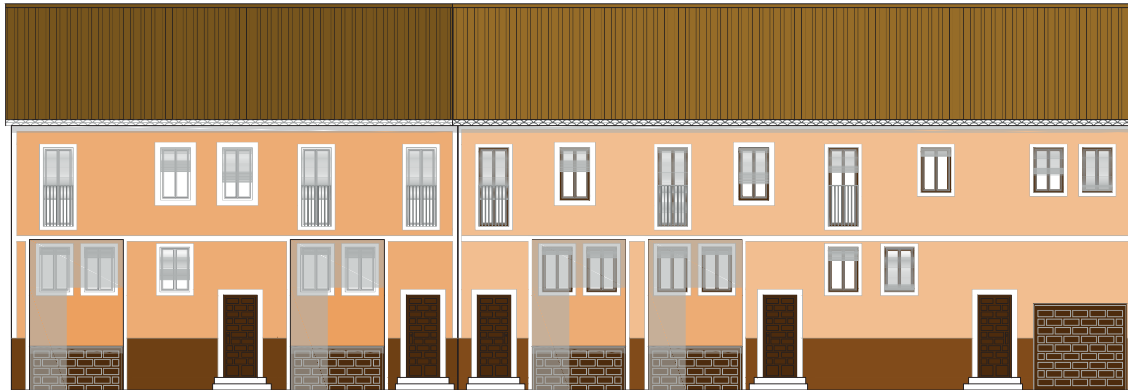
Alzado principal_BOCETO DE VIVIENDAS UNIFAMILIARES